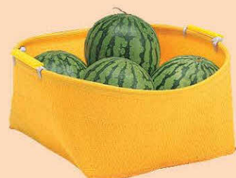
#145 キャリーポテ (ジャンボ) 規格：約52×22cm (H) JAN：4956674014507