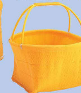
#123 ハンディポテ (HL) 規格：約35×23cm (H) JAN：4956674012305