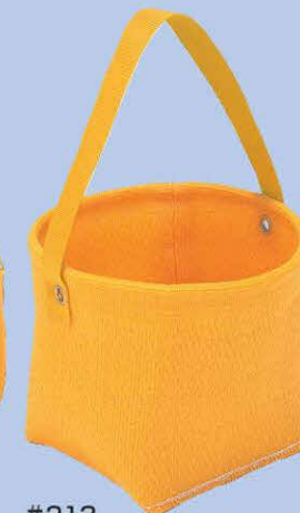
#213 ノーリツポテ 規格：約31×28cm (H) JAN：4956674021307