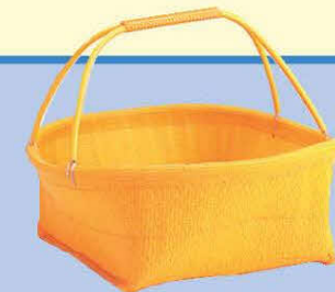
#121 ハンディポテ (HS) 規格：約38×15cm (H) JAN：4956674012107