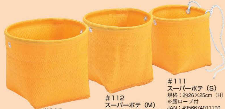
#113 スーパーポテ (L) 規格：約31×28cm (H) JAN：4956674011308