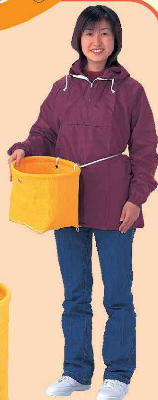
#111 スーパーポテ (S) 規格：約26×25cm (H) ※腰ロープ付 JAN：4956674011100